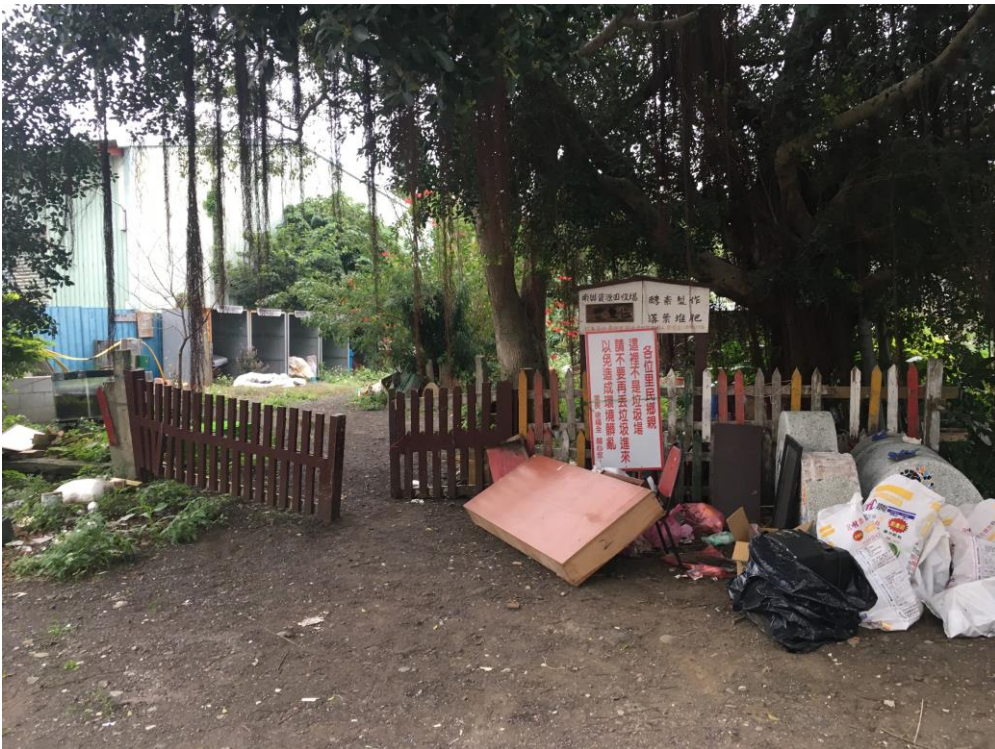
圖 現況照片，左為樟樹右為榕樹，內有堆肥區與資源回收區