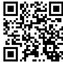
國立空中大學推廣教育中心 臉書粉絲專頁 QR Code