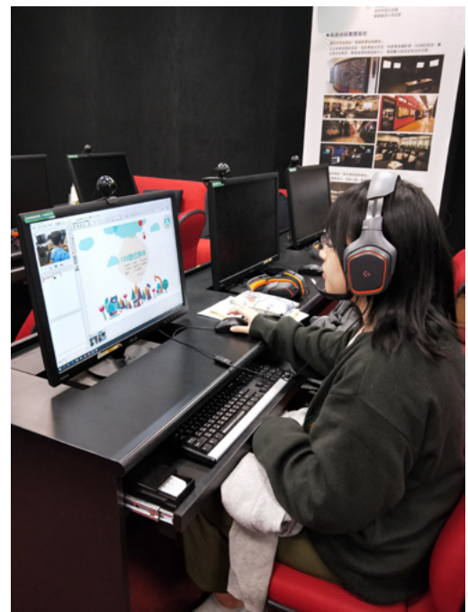
▲ 大學伴進行線上視訊教學服務的畫面。

服務學習，服務即是學習。從小孩身上，學習如何自我反思；從長者身上，學習如何面對生命與自己相處。不論服務哪個層面，受益者都不會只是對方，更是服務自己。