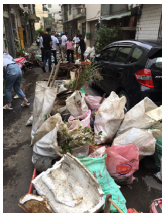
▲ 居家修繕 - 頂樓雜物清除。