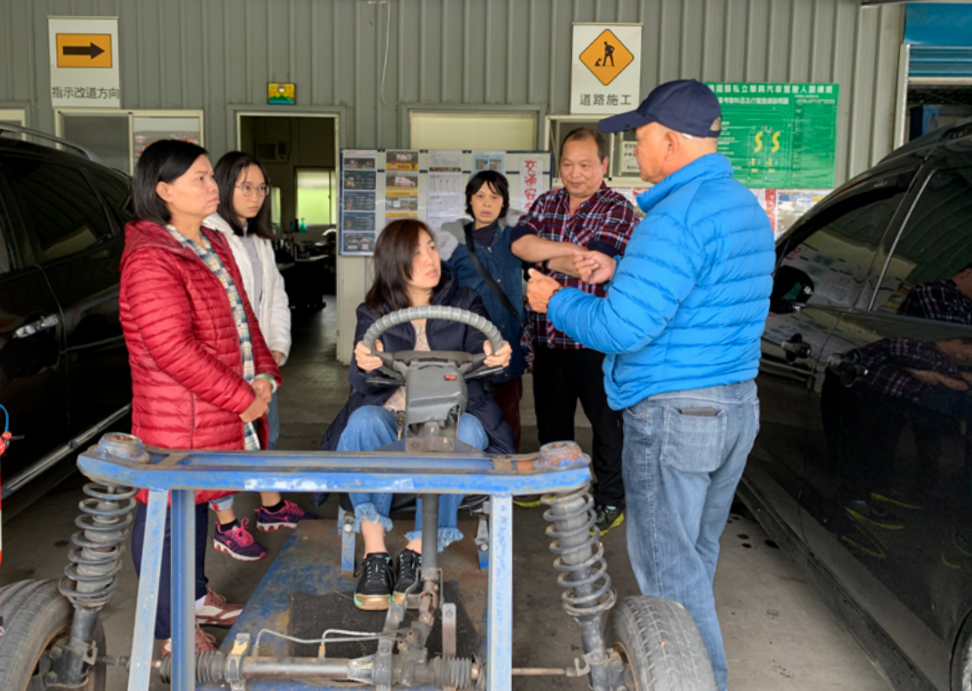
◀ 汽車駕訓班上課畫面。