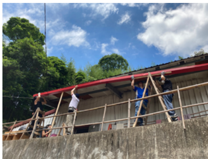
▲ 居家修繕 - 鐵皮屋雨溝更新。