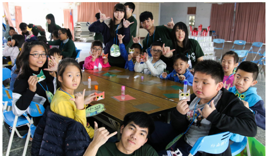
▲ 小隊員們與營隊大哥哥大姊姊的合影。

大學裡透過參與社團認識來自不同系的夥伴，有著相同理念人相聚在雲林嘉義聯合校友會，看到家鄉所面臨到的困難或有所缺乏，集結夥伴們一同回到家鄉貢獻一己之力進行服務，不僅是帶給小朋友們不同的假期生活，也讓參與的夥伴們為自己的大學生活添上不一樣的色彩與意義。在活動中所得到的深刻體悟與感動，都是要靠自己實際參與後才會有的感受，而不管是什麼樣的經歷，都會成為自己未來的養分，滋潤著自己的未來，讓自己成為耀眼的那顆星。