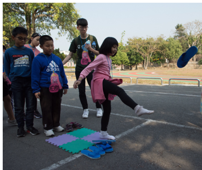
▲ 活動過程，以遊戲帶動營隊氣氛。