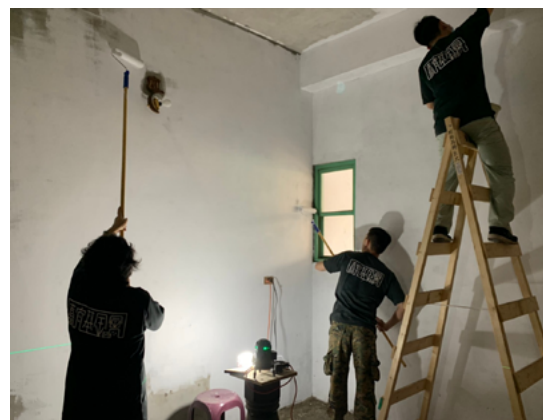
▲ 居家修繕 - 牆面粉刷。