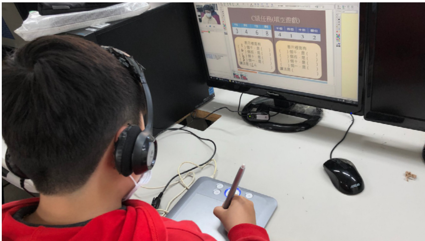
▲ 小學伴使用手寫板進行題目回答。