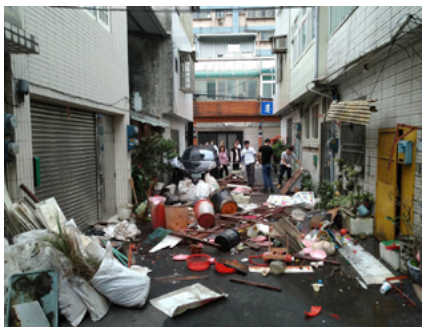
▲ 居家修繕 - 清除三大車廢棄物。

在「弱勢急難」中的居家修繕，與中原大學、南亞技術學院合作，雖然修繕過程有時很辛苦，卻也時常伴隨著讓人感到溫馨的事情。像是有次服務中，志工們為一位老婆婆修繕家中屋頂，修繕前發現家中的雜物實在太多，造成修繕不便，因此決定先幫老婆婆清出家中的雜物，沒想到最後竟清出三台卡車的量，志工們都感到非常疲憊，附近的居民看見志工們的辛勞後，溫馨地提供茶水供志工們飲用，即使這只是個小小舉動，卻能使力盡筋疲的志工們感受到無比的暖心。