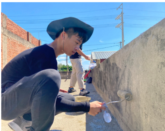
▲ 居家修繕 - 頂樓防水工程。

「弱勢急難」除了在發生天災、意外或者家庭變故下進行關懷外，還會針對服務對象的概況，與服務對象討論過後，提供生活上的需求及短期經濟補助，使對方恢復社會功能，此外在這項服務當中還有居家修繕，是針對桃園的弱勢以及偏鄉，提供有需要的家庭進行修繕服務，提升他們在環境與居家上的安全，例如為他們打造無障礙空間；「創新賦能」的服務內容則有社區補助與汽車考駕班，主要是以社區產業為主，經由社區提供提案後，基金會再給予相對的補助款，讓社區更能發展自己的產業；「志工培力」則是希望在未來能開培訓課給志工及有興趣之學生、民眾，提升志工的專業技術，好讓居家修繕進入更多需要的家庭。