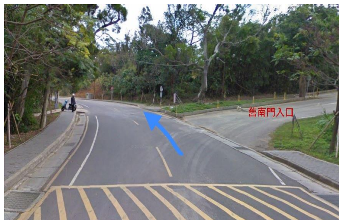
2. 育成創新大樓→ 舊南門入口