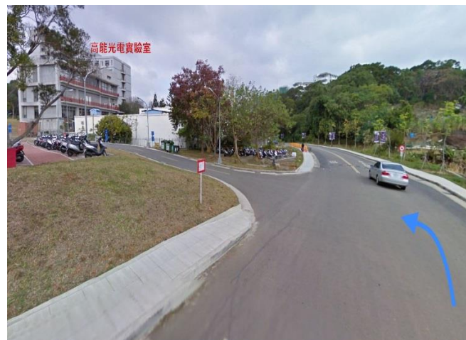
4.南校區廢水處理廠 →左轉 奕園停車場