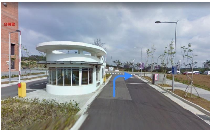
1.南門口→右轉 育成創新大樓