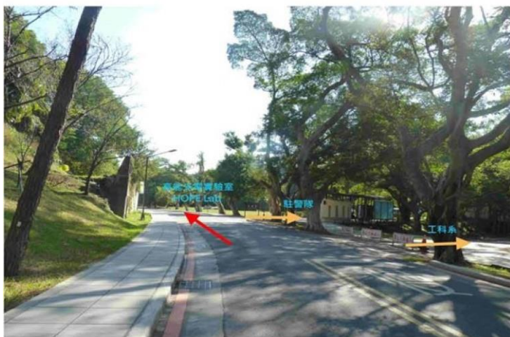
4 野台(小吃部旁)→駐警隊