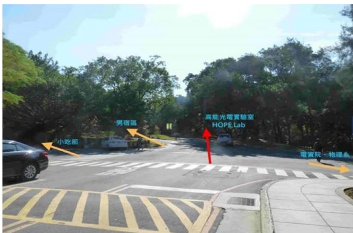
3 圖書館→野台(小吃部旁)