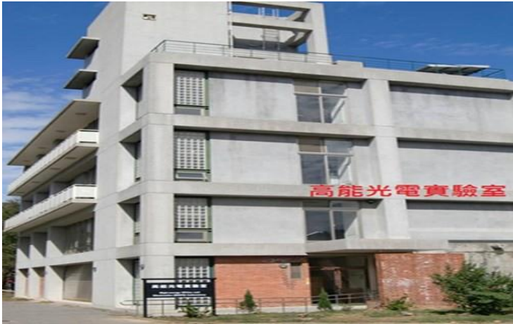
5. 奕園停車場→高能光電實驗室