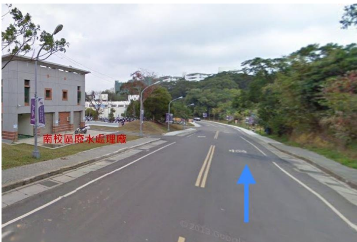
3. 舊南門入口→南校區廢水處理廠