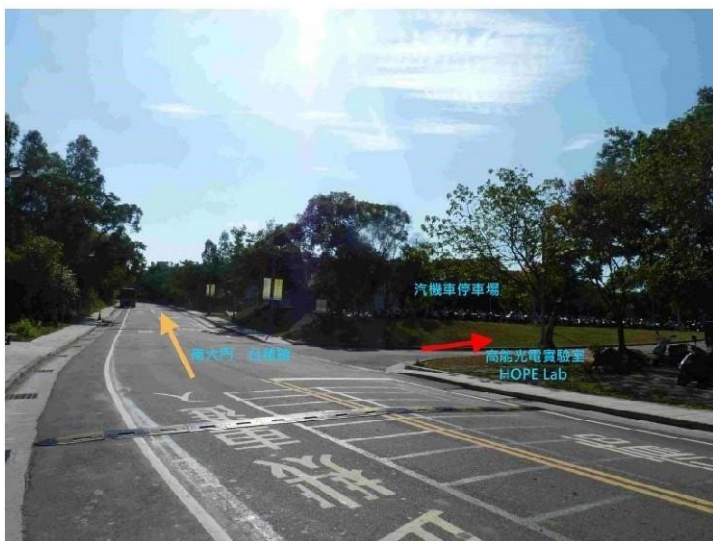
|7 荷塘→奕園汽機車停車場|