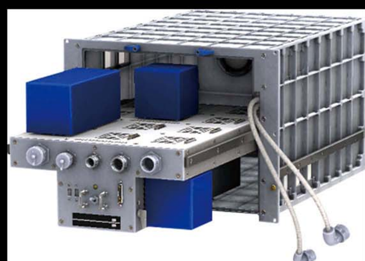
ESA ICE Cubes