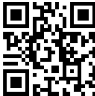
國立雲林科技大學 工業工程與管理系