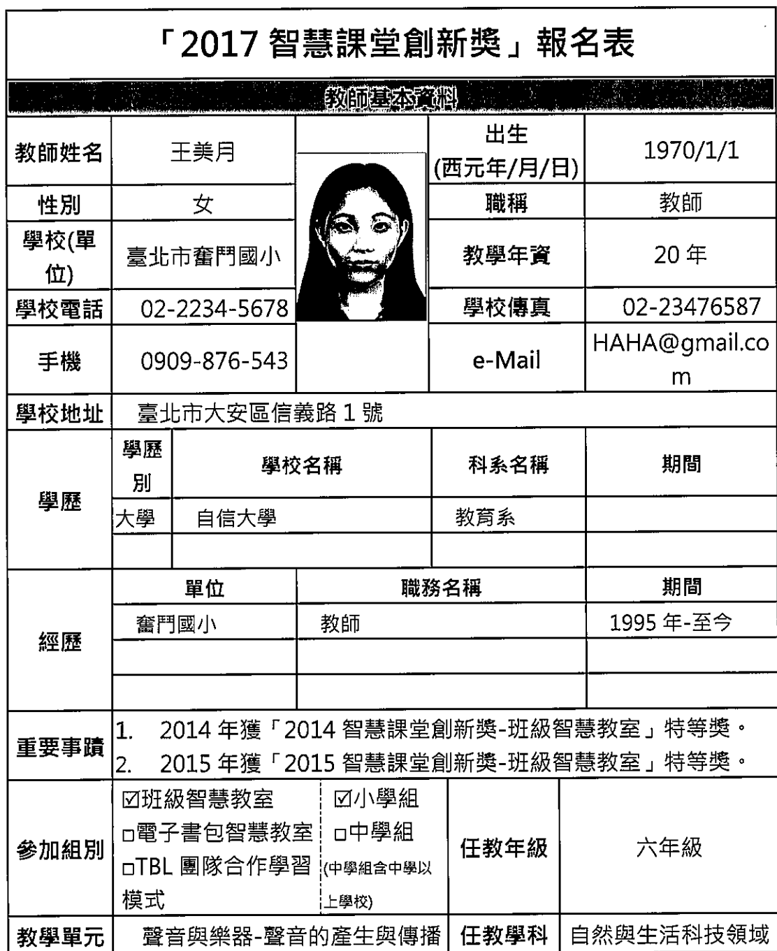
「2017 智慧課堂創新獎」報名表繳交範例