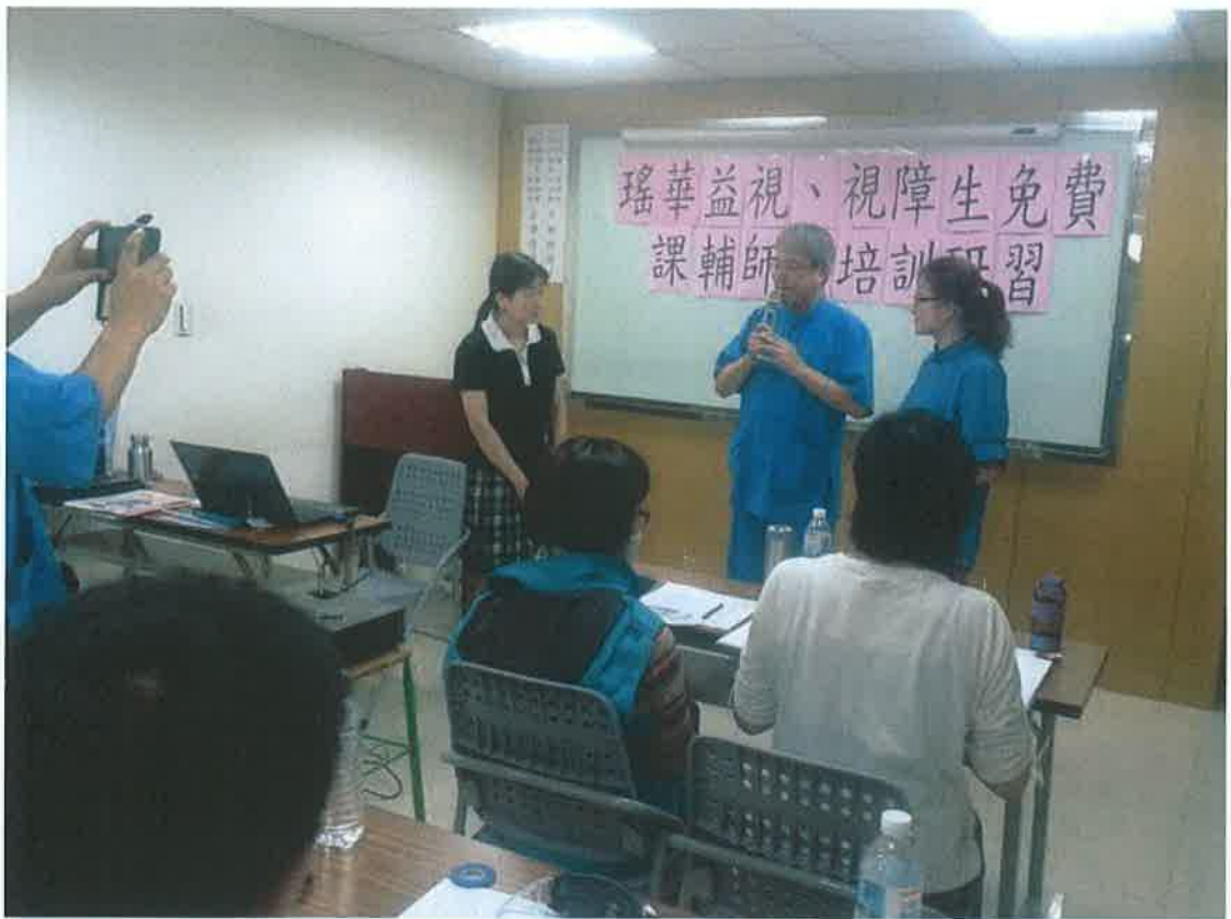
課輔師資培訓研習-本基金會創辦人及董事長到場向視障專業特教講師致意