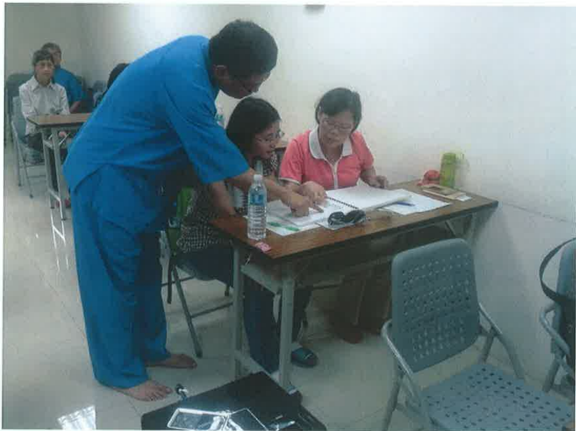
課輔師資培訓研習-學員互相討論學習心得