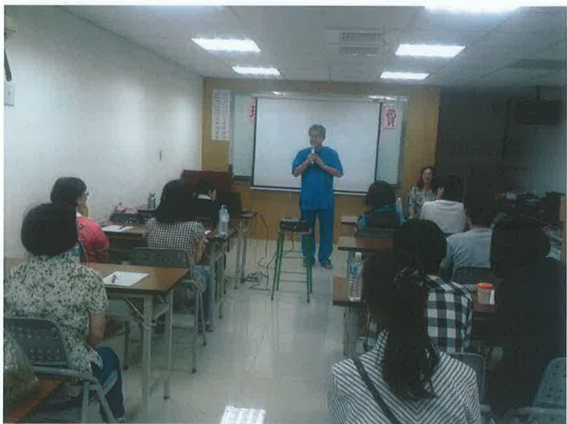
課輔師資培訓研習-本基金會創辦人向全體輔導老師致意