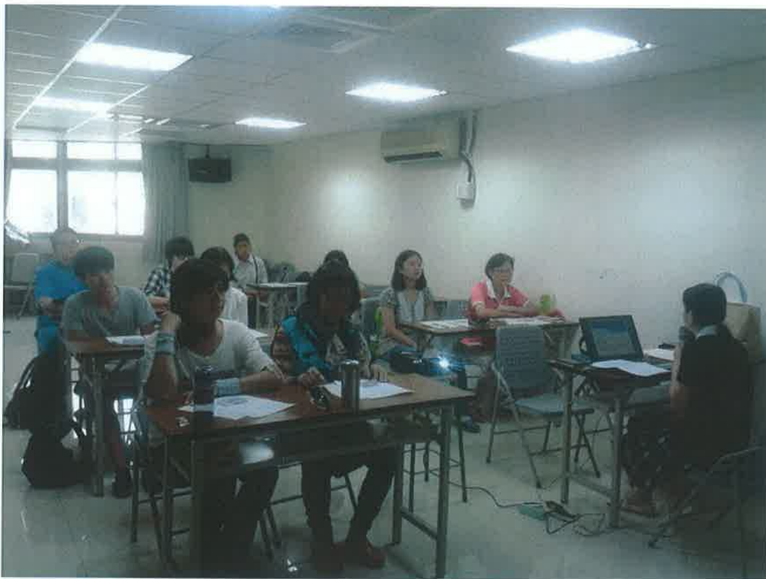
課輔師資培訓研習-學員全神貫注聽講