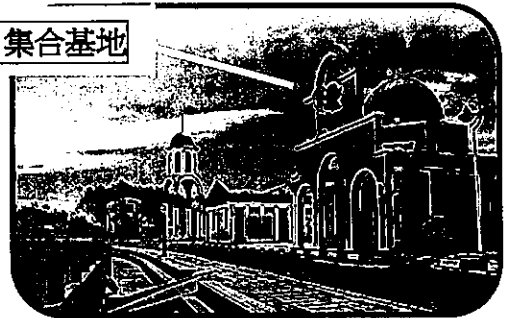
新竹騎跡 集合基地