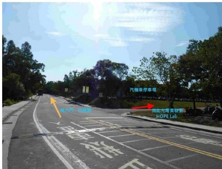
7 荷塘→奕園汽機車停車場