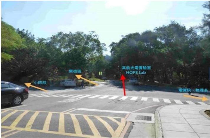
3 圖書館→野台(小吃部旁)