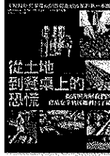
從土地到餐桌上的恐慌

作者/周柱田、徐健銘 出版社/商周 透過與理解我們的食品安全到底哪裡出了錯，政府失能、企業無心、食品市場燃起烽火，食安問題重新成為公民團體的契機。面對食安擔憂，我們除了憤怒與恐慌，更需要認識與掌握，參與它，才能改變它。