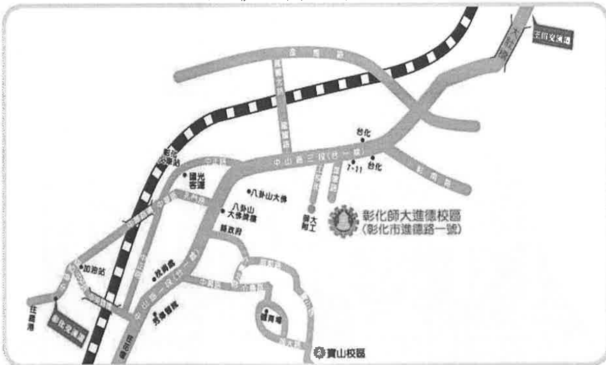
國立彰化師範大學位置圖